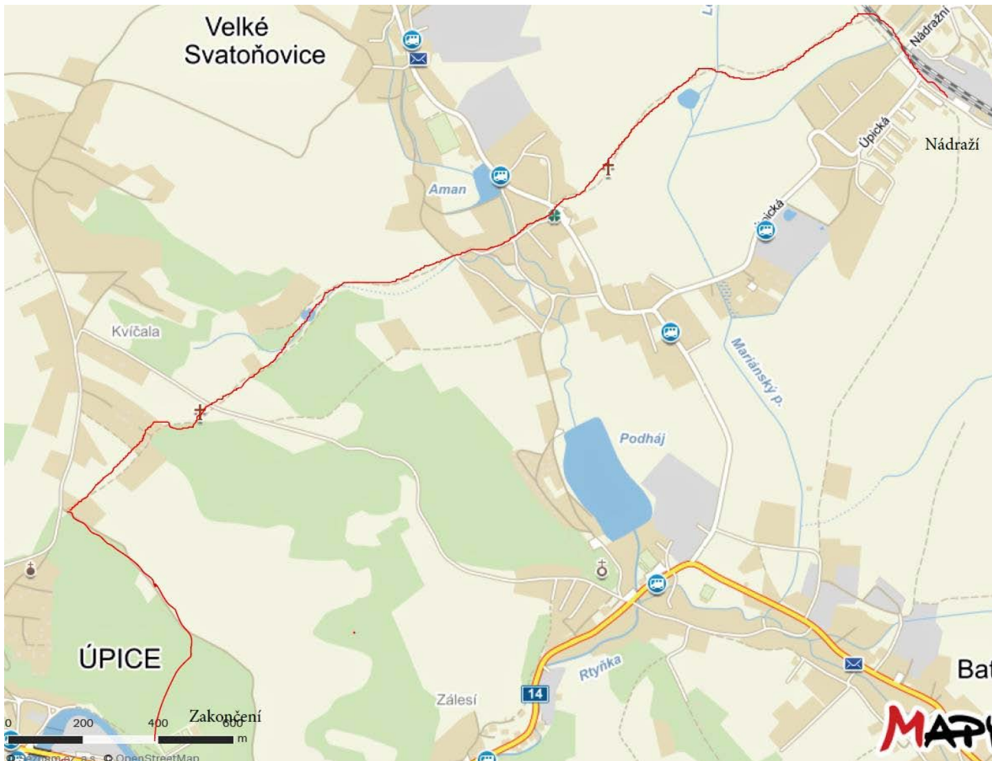
Cesta na nádraží Malé Svatoňovice